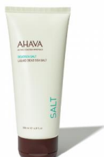
Le sel liquide de la mer morte

+ Minéraux de la mer Morte : apaisants, purifiants et antioxydants, les minéraux de la mer Morte, reconnus Facteurs d'Hydratation Naturels (FHN), permettent à la peau de maintenir un taux d'hydratation optimal, jour après jour.