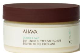
Gommage beurre de sel exfoliant

Avec sa texture onctueuse, généreuse, riche en huiles végétales et en sels de la mer Morte, le gommage beurre de sel exfoliant AHAVA donne à l'exfoliation une dimension somptueuse et surprenante. Fondant, il nourrit la peau en profondeur, tout en éliminant délicatement cellules mortes et impuretés. Au contact de l'eau, le gommage beurre de sel exfoliant AHAVA devient un lait doré nourrissant fluide aux légers arômes de mandarine et de cèdre. Ce gommage corps laisse la peau lisse, merveilleusement douce et bien hydratée.